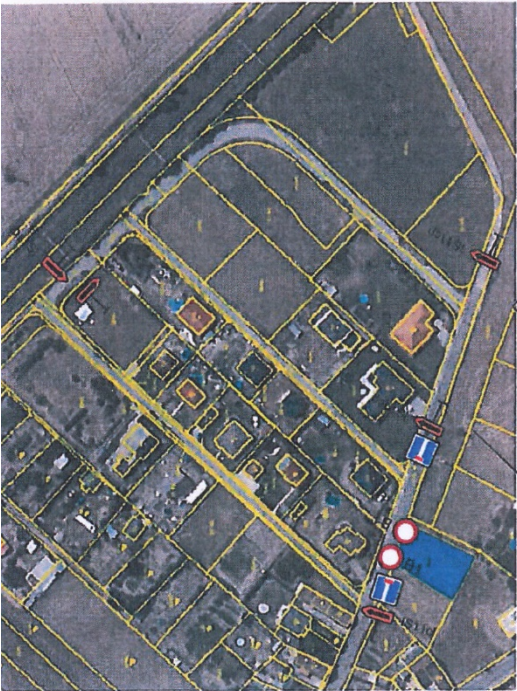
MAPA OBCE M 1:2000